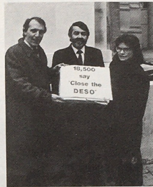
Cyflwyno deiseb sy'n galw am gwaith Mudiad Gwasanaethau Allforion Amddiffyn y Llywodraeth

Mae Ffrwydron Tanwydd Awyr (FFTA) yn dynwared ton ffrwydrad bom niwclear ar raddfa fechan, gan sugno'r ocsigen o'r awyrgylch. Gall y FFTA a ollyngir o'r awyr greu cylchfa pwyssedd ffrwydrad rhyw 1,000 troedfedd o hyd, a chanwaith yn fwy na fyddai ei angen i brofi'n